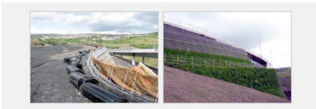
Obrázek č. 6: Svah budovaný systémem Tensartech GreenSlope, Bargoed 2008

Při řešení násypu ve městě Bargoed (Wales, Velká Británie) výšky až 22 m a sklonu 60° bylo využito systémového řešení pomocí systému Tensartech GreenSlope především z důvodu urychlení výstavby. Svah po ozelenění nenásilně zapadl do hustě osídlené oblasti.