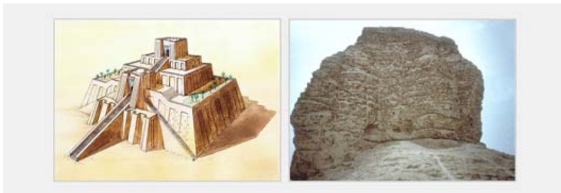
Obrázek č. 1: Ziggurat v Babylóně odolávající zubu času více než 3000 let

Příkladem takovéto konstrukce je bezpochyby ziggurat v Babylóně (dnešní Irák) výšky až 60 m. Zikkurat byl vystavěn před 3000 lety z jílovité zeminy, která byla zpevněna pomocí palmových větví. Do dnešní doby se zachovala část konstrukce, která dokazuje správnost rozhodnutí stavitelů využít při výstavbě kombinaci dvou materiálů – viz. obrázek č. 1.