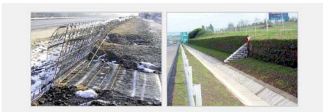
Obrázek č. 5: Svah budovaný pomocí ztraceného bednění, Maďarsko 2001

Při výstavbě svahu u rychlostní komunikace M1 vedoucí do Budapešti bylo použito také vyztužení v kombinaci s KARI sítěmi jako ztraceného bednění, viz. obrázek č. 5. Svah délky 180 m, výšky 3 m a sklonu 75° byl budován v zimních měsících a celková doba výstavby byla pouhých 8 týdnů.