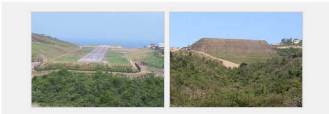
Obrázek č. 3: Svah výšky až 31,5 m na ostrově Montserrat, 2005