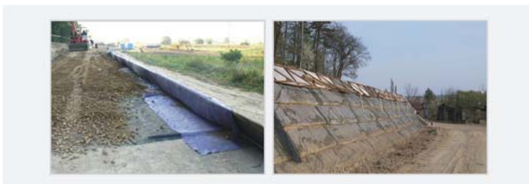
Obrázek č. 4. Svah budovaný pomocí posuvného bednění, Bučovice 2008

Posuvné bednění tvoří dočasné podepření líce v požadovaném sklonu během hutnění. Po přestavbě bednění na následující vrstvu je líc vrstvy chráněn zataženou geomříží pod následující vrstvou. Svah je tedy tvořen postupným zatahováním geomříží pod následující vrstvu při současném přestavování posuvného bednění. Konstrukce budovaná pomocí posuvného bednění je vidět na obrázku č. 4. Na průtahu Bučovicemi byly postaveny tři zdi, které mezi sebou plynule přecházeli pomocí vyztužených svahů budovaných právě pomocí ztraceného bednění.